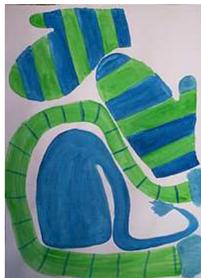
Jana Šenkýřová, 9.C

V rámci programu „Výchova dětí v oblasti požární ochrany“ k nám zavítali hasiči z místní stanice hasičského záchranného sboru. Program je určen pro žáky 2. a 6. ročníku. Klade si za cíl seznámit děti s modelovým chováním v případě požáru, nehody, nenadálé události, přiblížit práci hasičů a v neposlední řadě také výchovně působit na žáky v oblasti požární prevence. Celý program je rozdělen do tří částí. Dvě z nich probíhají přímo ve třídě, třetí - nepovinná – bude asi nejatraktivnější. Protože děti budou moci navštívit požární zbrojnici a všechno okouknout pěkně zblízka.