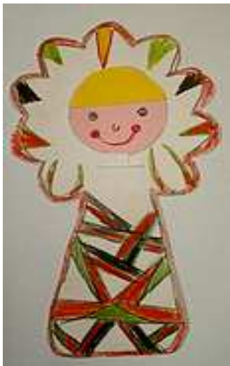
Vladimír Horák, 1.tř.