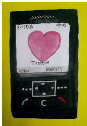
Dagmar Konečná, 9.D